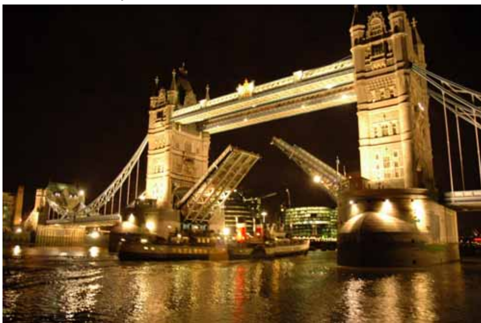
“ฟ้าเปิดรับการกลับมากกรุงลอนดอนของพ่อเจ้าแล้ว”

ในวันที่จะออกจากบ้าน ข้าพเจ้าเกือบลืมหยิบ “อัฐิและพิน” ของท่านไป แต่ด้วยลูกสาวช่วยเตือนความจำให้จึงไม่พลาดความตั้งใจ ตลอดการเดินทางจนถึงกรุงลอนดอน ข้าพเจ้ามักจับกล่องอัฐิที่ไว้ในกระเป๋าเสื้อนอก และพูดในใจกับคุณพ่อว่า ขณะนี้เดินทางถึงย่านใดๆ แล้ว เป็นประจำทุกวันที่อยู่ในอังกฤษ เสมือนหนึ่งว่าท่านร่วมเดินทางมาด้วยจริงๆ จนกระทั่งคืนสุดท้ายก่อนเดินทางกลับ วันที่ 29 กันยายน 2548 ผู้จัดงานได้จัดงานเลี้ยงส่งคณะข้าราชการไทย และพาล่องเรือชมแม่น้ำเทมส์ยามค่ำ ในช่วงที่เรือล่องกลับจากทางใต้ขึ้นเหนือเป็นเวลาท้องถัน 20.15 น. เรือของคณะหยุดเรือใหญ่วิ่งผ่านสะพาน “Tower Bridge” ให้รู้สึกตื่นตื้นไปกันทั้งลำ ขณะนั้นสะพาน “ยกขึ้นทั้งสองด้านเสมือนยกมือขึ้นสู่ฟ้า” ทำให้ข้าพเจ้าคิดถึงเกร็ดโหราศาสตร์ที่คุณพ่อชอบอุปมาให้ฟังว่า